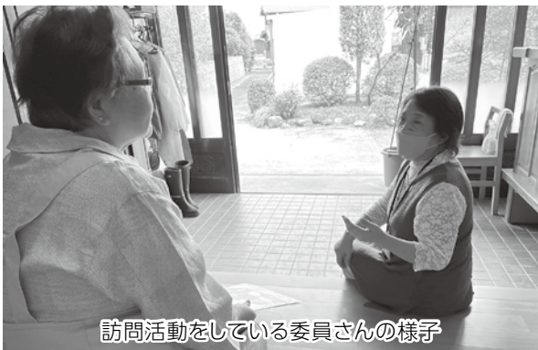
訪問活動をしている委員さんの様子