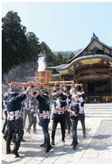
▲神湯が湧き上がるほど力強く掲げる氏子青年会

新型コロナウイルスの影響を鑑み、湯曳き車は使わずヤホールに展示するだけとしました。3年前とは内容を一部変更して行いましたが、前日から続く晴天により満開となった桜のもと、多くの方が訪れ、弥彦観光シーズンの幕開けをにぎやかに行うことができました。