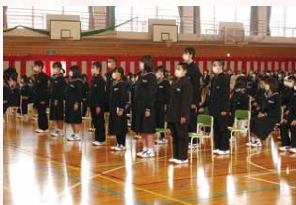
▲中学校 新入生紹介

新入生の皆さん、入学おめでとうございます。新たな環境で仲間とともに楽しく毎日を過ごしてください。