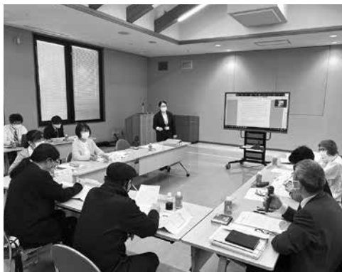
▲サポート会議の様子 委員の図書館への熱い思いに感謝です！

今回は、委員の皆さんからテーマに沿ってアイデアを出していただきました。それぞれバラエティに富んだ内容でワクワク感が満載でした！図書館の楽しみ方が更に増えそうな予感です。ご意見の一部をご紹介します。