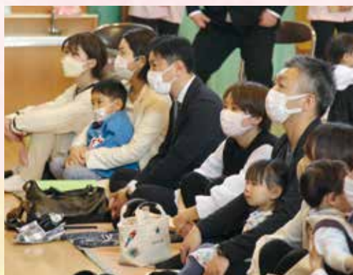
▲弥彦保育園 入園式の様子①