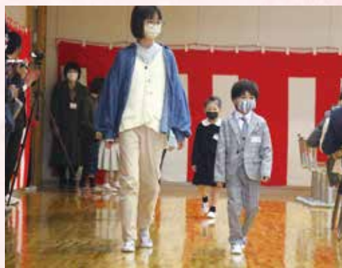
▲小学校 新入生入場

4月5日に村内各保育園で入園式が行われました。弥彦保育園に20名、二松保育園に11名、ひかり保育園に11名のきらきら輝く可愛い園児たちが加わりました。