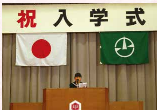
▲中学校 新入生誓いのことば