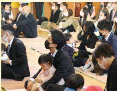
▲弥彦保育園 入園式の様子②