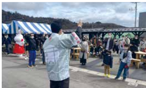
▲たくさんの人が参加したじゃんけん大会