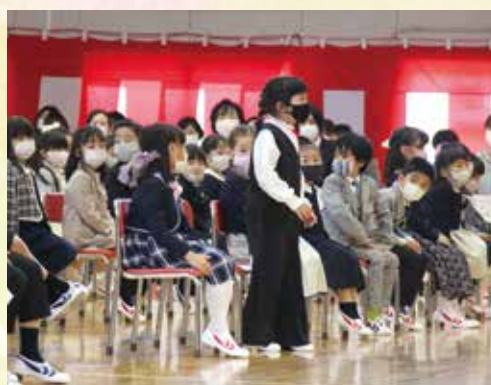
▲小学校 新入生紹介