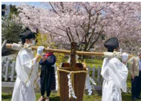
▲御神湯を運ぶ白丁姿の神湯持