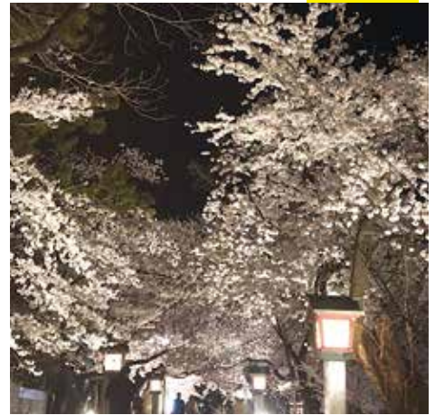
▲ライトアップされた弥彦公園の夜桜

今年も、弥彦公園の夜桜がライトアップされました。ライトの増設で、より幻想的となった弥彦公園の夜桜を目当てに多くの人でにぎわいました。