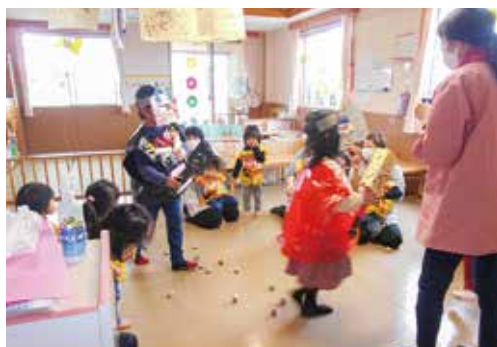
▲かわいいきく組さんの鬼

その後、福の神が登場し、園児たちに「福」をまいたりお菓子を配ったりして、教室は笑顔に溢れました。しかし、ほっとしていた子どもたちの前に大きな青鬼が現れ、パニックに。泣いてしまう子どももいましたが、最後はみんな力で合わせて無事に鬼退治に成功しました。