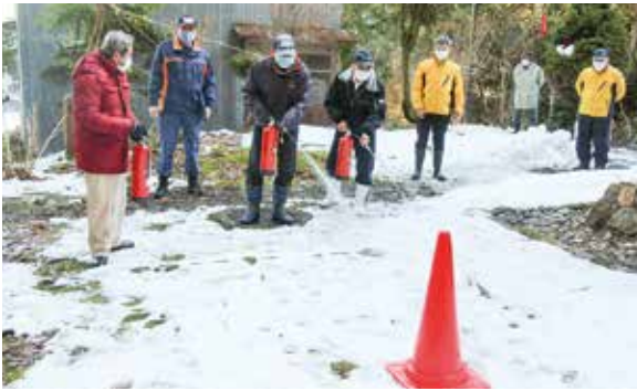
▲消火器の取り扱い訓練の様子