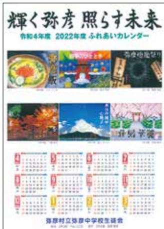
▲令和4年度のふれあいカレンダー

この取り組みは、地域貢献することを通して、生徒に自己有用感を育てるという目的で始まり、20年以上、脈々と受け継がれています。