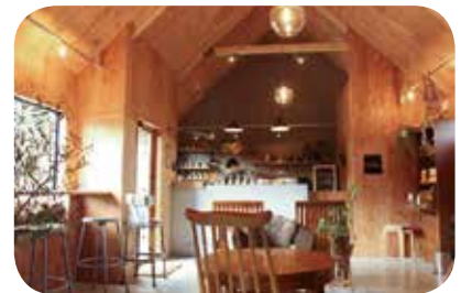
▲構造用合板の木目が印象的な店内は暖かみのある空間となっています

グレ)をオープンさせました。 alegreはスペイン語で「楽しい」「陽気な」という意味で、ロゴは国上山、弥彦山、多宝山、角田山をモチーフにご主人がデザインされたとのこと。