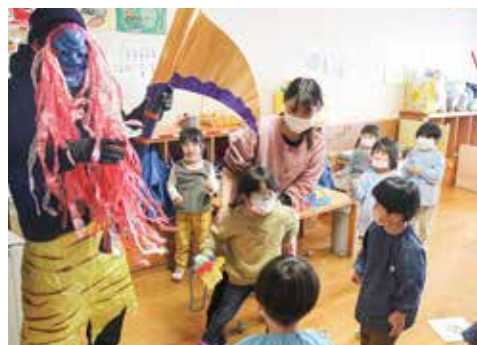
▲大きな青鬼の登場