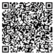
國稅庁HP 「タックスアンサー」

國稅庁ホームページ「タックスアンサー」、 「稅の情報・手続・用紙」をご覧ください。