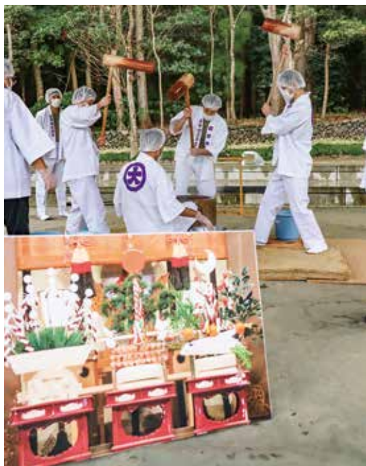
▲三光之飾と餅をつく自衛隊員

三光之飾：日、月、星を祀る正月飾りで、彌彦神社に残された古い絵巻などから情報を集めて再現されました。