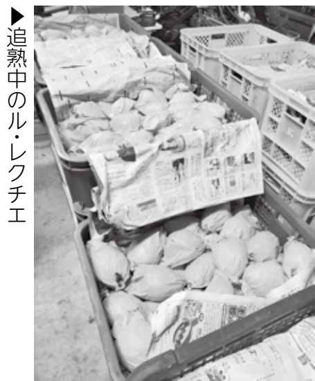
▶追熟中のル・レクチエ