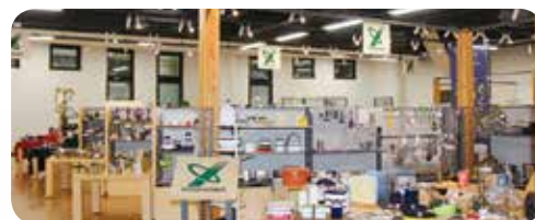
▲商品がずらりと並ぶショールーム