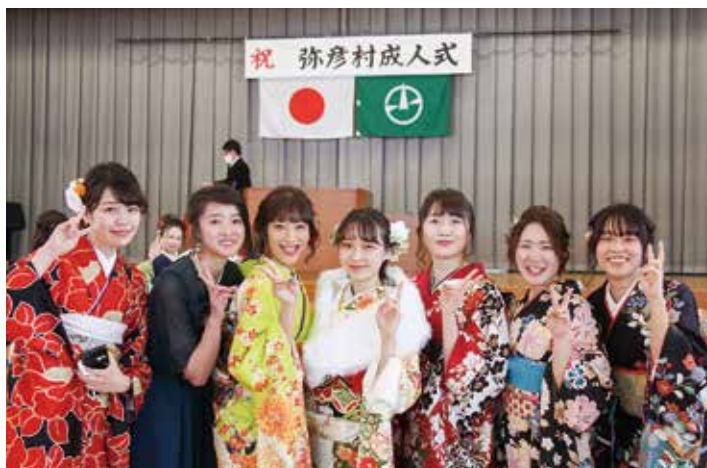
▲旧友との再会に笑顔の成人たち

11月22日、弥彦中学校体育館で成人式が行われました。成人を迎えたのは平成11年4月2日から平成12年4月1日生まれまでの89人です。色とりどりの振袖を着た女性陣に、ピシッとスーツを着た男性陣が、成人としての決意を胸に、気持ちを引き締めていました。仲間たちとともに、ふるさと弥彦を大切にしながら、夢に向かって、これからも頑張ってください。