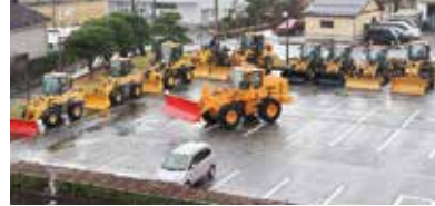
▲出番を待つ除雪車(中央:14t級の除雪車)