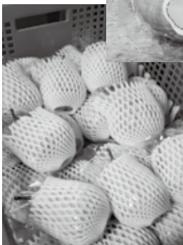
▶出荷されるル・レクチエ