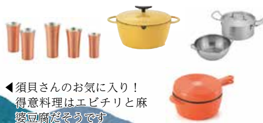
◀須貝さんのお気に入り！得意料理はエビチリと麻婆豆腐だそうです