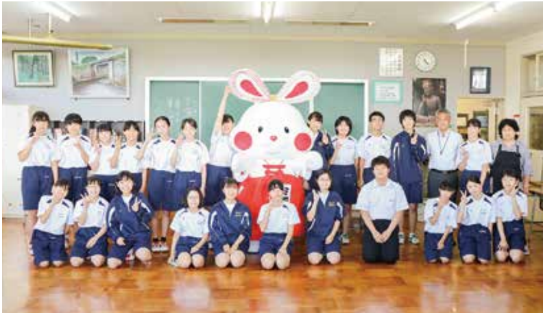
▲美術部の皆さんと記念写真

7月30日、弥彦村の新しいマスコットキャラクターのデザインをお手伝いした弥彦中学校美術部の生徒にミコぴよんがお披露目されました。 生徒たちの間で「かわいい」という声飛び交っていました。