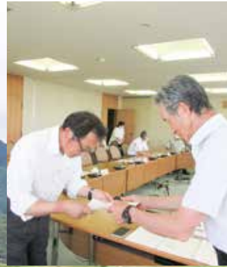
推進委員への委嘱状交付の様子