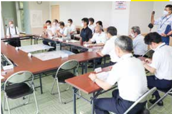
▲移転後の災害対策本部の様子

8月5日に、災害対策本部移転訓練が行われました。 当日は役場庁舎が水没の恐れがあるという想定で、弥彦競輪場の特別観覧席に災害対策本部を移転しました。この訓練により、気付いた点、反省点を踏まえて改良していきます。