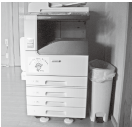
▲上泉公会堂に整備された車椅子（上）とコピー機（下）