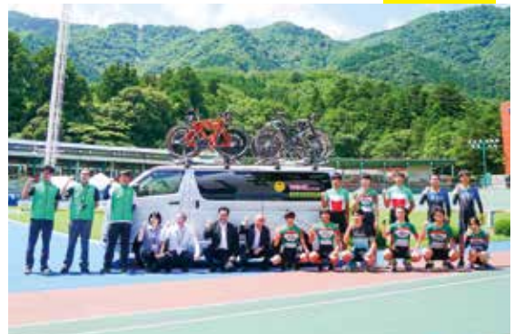
▲自転車競技に励む高校生と新潟県自転車競技連盟の方々

8月1日、新潟県自転車競技連盟への遠征用車輛の贈呈式を行いました。 弥彦競輪開設70周年記念事業として、新潟県自転車競技選手強化育成を図るため、県内外の大会等の遠征用車輛として9人乗りワゴン車を新潟県自転車競技連盟に弥彦村より寄贈しました。 これにより安全快適に県内外へ遠征に出かけられるようになります。