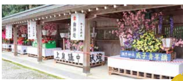
▲拝殿前に並ぶ大燈籠