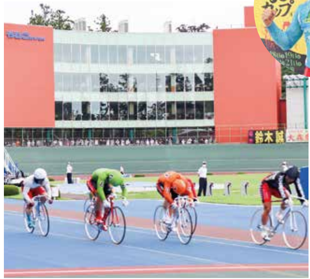
▲決勝 白熱するゴール前