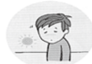
「ゆううつな気分になる」