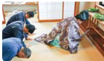
▲山じまい式の様子