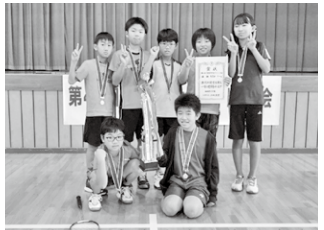
▲頑張った子ども達

結果 優勝 矢作Bチーム 2位 上泉Aチーム 3位 麓二区観音寺Aチーム 井田チーム