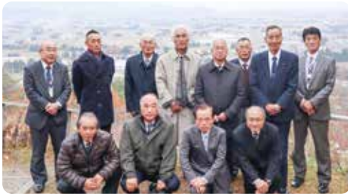
▲飯豊町展望台にて