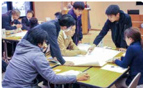
▲グループ討議の様子