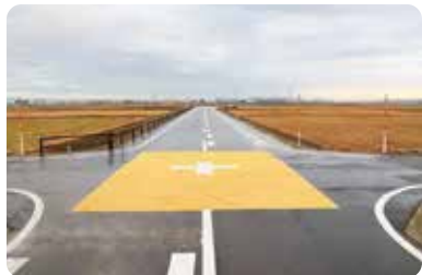
▲開通した村道美山大戸線

これにより、山崎川崎線との交差点における道路の優先順位が変わります。美山大戸線が優先となり、山崎川崎線の通行車両は一時停止となります。そのため、交通事故には、これまで以上に注意してください。