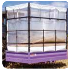
◀もみがらキャリア 農作業機の中では珍しい 藤色 ！