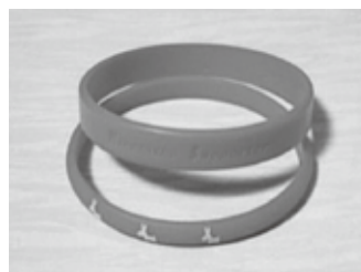
認知症サポーターの目印 オレンジリング

います。ひとりでも多くのサポーターが増えることが、誰もが安心して暮らせるまちづくりにつながります。興味関心がある人は福祉保健課までご連絡ください。