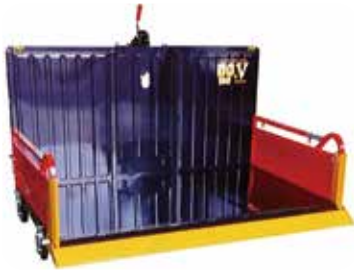
◀整地キャリア これからの季節、トラクターの後ろに付いて奮闘する姿が見られると思います。