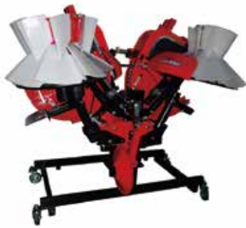
▲マンタセブン 左右の畦整形部で塗り残し無し！

てはいませんが、実際に農作業されている田んぼや畑に出向き、農家から製品の評価や悩み事を聞いたたり、販売店を通して農家の要望を把握して製品の開発、改良に努めています。こうした研究開発の積み重ねで、富士トレーラー製品には多くの 特許技術 が反映されており、他社にはない製品を作っています。 中でも、畦塗機 マンタセブン は全国各地で条件を選ばず強固な畦を作ることが可能な機械であるとして高く評価されています。 また、 整地キャリア は年間約2000台販売され、整地・運搬作業だけでなく、積雪時には除雪作業で力を発揮しています。 特許技術を開発し、農業を支える仕事に興味がある方は、株式会社富士トレーラー製作所の門を叩いてみてはいかがでしょうか。