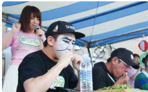
▲昨年のリベンジに燃えるカブキンさん!みごと優勝!