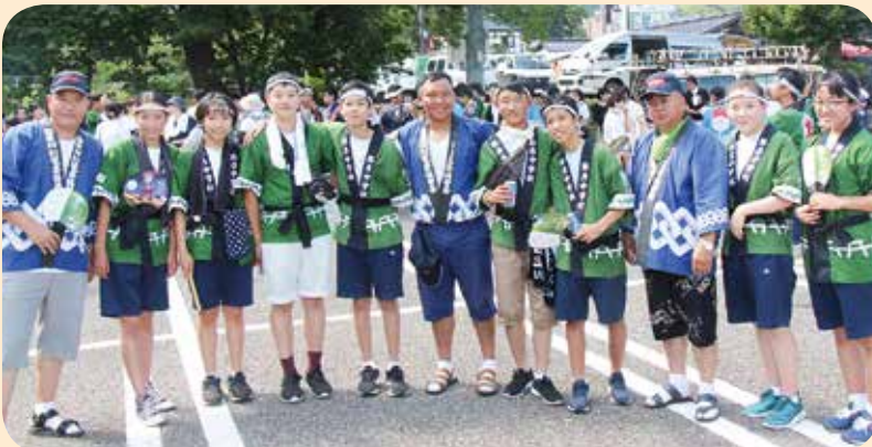
▲お揃いの法被を着て、気持ちは1つ!