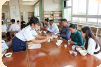
▲牛乳パックのたたみ方をレクチャー!