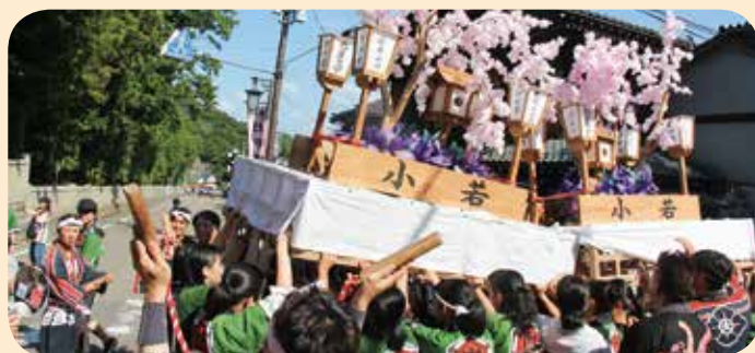
▲みんなで力を合わせて！