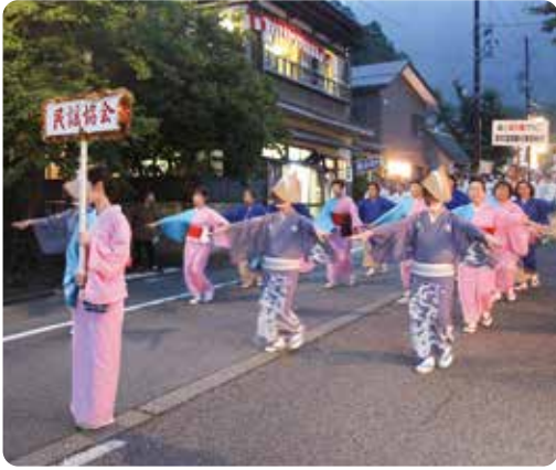
▲踊り子総勢300余名による大民謡流し

メインとなる25日は午前中の灯籠駅伝大会からはじまり、午後からは青年・芸妓連の灯籠押しに続いて、小中学生の灯籠押しが猛暑のなか威勢よく彌彦神社をスタートし町内を巡りました。夜は大灯籠が巡行するなか、打ち上げられる花火が美しく弥彦の夏を彩っていました。 26日の還御祭が終了し、3日間の神事が滞りなく無事に終了となりました。