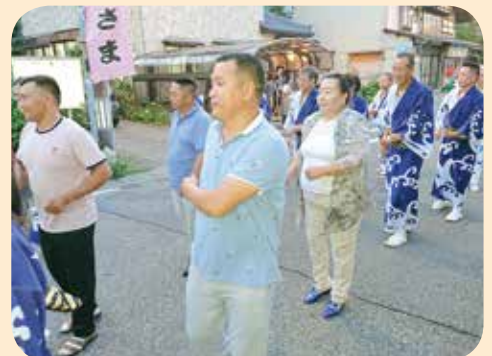
▲日本の踊りを体験!