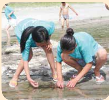
▲浅瀬にいる貝や魚に興味津々！