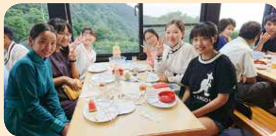
▲お別れ夕食会での1コマ▼

エルデネ村の子ども達は、ホームステイ先で経験した手洗いうがいなどを帰国したら友達に伝えたい、浴衣を着てお祭りに行ったり、野球部の練習に参加して気持ちがほぐれたと感想を述べていました。