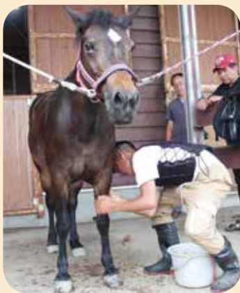
▲モンゴルでの馬の手入れを教えてくださいました