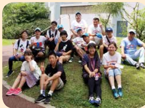
▲楽しかったマリニピア日本海