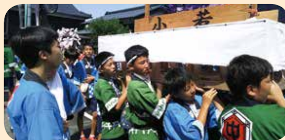
▲燈籠を担ぐ中学生とエルデネ村の子(緑法被の真ん中)

ホームステイを受け入れてくださったご家族をはじめ、栗島浦村のみなさん、ご協力いただいたみなさんに深く感謝申し上げます。