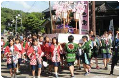
▲皆で花をつけた花灯籠で巡行!