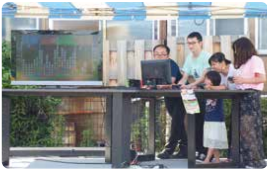
▲子どもも大人も「ぷよぷよ」で対決!

やひこマルシェも同時開催され、多くの人で賑わう中、Eスポーツ「ぷよぷよ」大会が行われたり、YouTubeでEDAMAME Arcade Channelを配信しているSQUARE ENIX(スクウェア・エニックス)さんが進行を務めた枝豆早食い競争や抽選会があり、照りつける太陽にも負けず盛り上がりました。