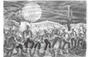
「満月の夜にインディオの踊り」

地球の(宇宙)の神秘さと美しさに我を忘れて感動し、それを少しずつ体感しながら制作を続けている先生の、感動の軌跡が作品群となりました。