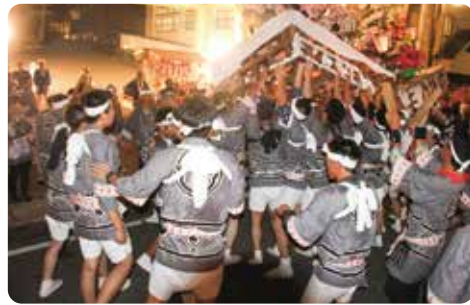
▲意気高らかに灯籠押し!