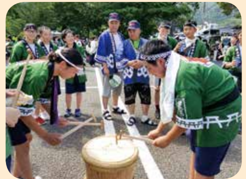
▲樽太鼓に挑戦するエルデネ村の子(左)

エルデネ村長達は、民謡流しの列に加わり、一緒に踊って、弥彦のまつりを楽しみました。まつりに参加する中で親睦も深まり、微笑ましい光景が見られました。