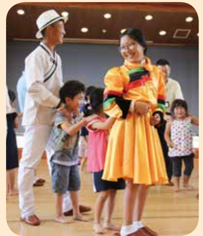
▲ゲームで触れ合い交流