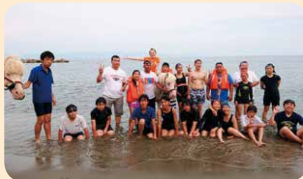
▲一緒に海水浴を楽しんだ仲間達！