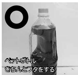
ペットボトル きちんとフタをする