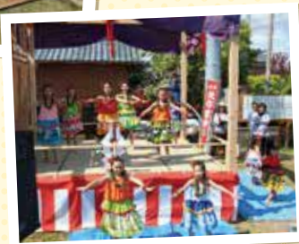
子どもたちによる フラダンスの披露

春季大祭に合わせて、里神楽やカラオケ、子どもたちによるフラダンス等が盛大に披露され、会場を訪れた地域の皆さんはとてもしそくに過ごしていました。 この「コミュニティ助成事業」では、里神楽保存会の他に平成26年度の大字矢作地区、平成23年度に峰見地区と弥彦山太鼓保存会が助成を受けています。 皆さまも、地域活動活性化のために、この「コミュニティ助成事業」を活用してみたいかがでしょうか。