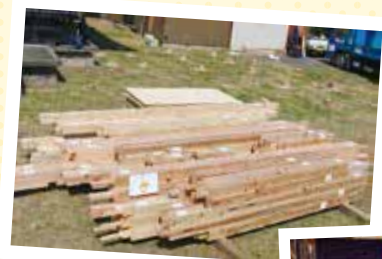
補助を受けて新調した 仮設舞台の骨組み