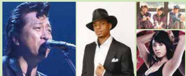
【写真】左：高橋ジョージ、中央：ジェロ、右上：Negicco、右下：柳ゆり菜

この他、先着来場者プレゼントやメインレースの早朝予想会、有名タレントが出演するインターネット公開中継も4日間実施します。イベント内容は変更の場合がありますのでご了承ください。