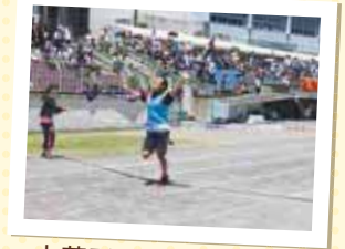
大花形リレーで優勝した上泉チーム