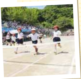
1年生は初めての運動会!!

5月23日、弥彦小学校では大運動会が行われました。初夏を感じる日差しの中、子どもたちは、競技や応援に力いっぱい取り組んでいました。その姿に、応援に駆け付けた大勢の保護者の皆さんからも大きな声援が送られていました。