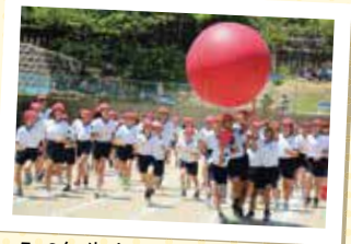
5、6年生合同競技 「ダッシュ大玉 弥彦スペシャル」