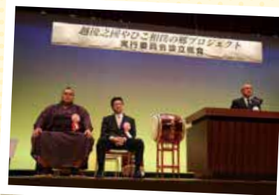
第1部 実行委員会設立総会