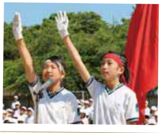
両軍応援団長の選手宣誓