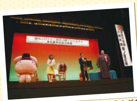
第2部 アトラクションにはもちうさぎも登場!!