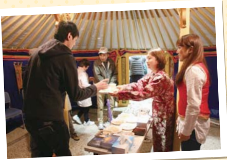
▲ヤホール内にはモンゴルの伝統住居ゲルも登場！ 見学者でにぎわいました