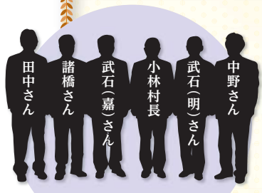
当日出席された方々