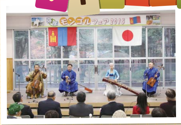
▲馬頭琴・ホーミーの演奏を披露するイフ タタラガの皆さん