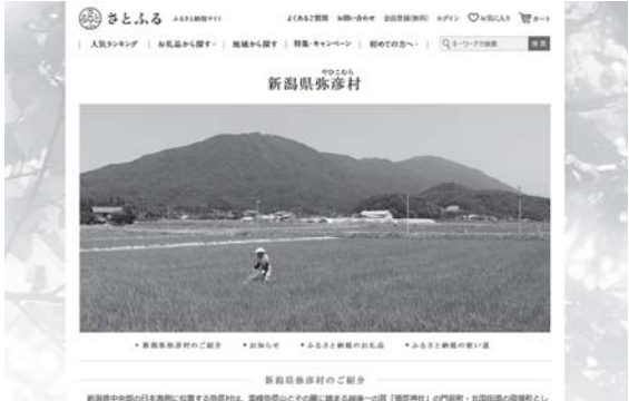
▲“さとふる”弥彦村ページイメージ

直後から、全国各地から寄附が寄せられ、今年度10月31日時点で寄附件数1千581件、寄附金額は1千969万円となっています。「さとふる」のほかに役場へ直接申し込みのあった7件、210万1千円を含めると、10月末時点で2千万円を超える寄附が寄せられており、これは過去にない数字となっています。