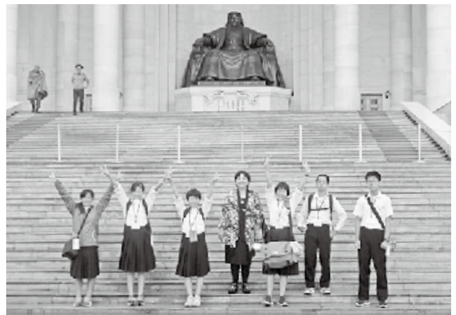
▲国会議事堂前でエルデネ村村長と記念撮影

モンゴルの人たちはみんな優しく、姉妹都市が長く続くと嬉しいです。私もモンゴルの人と仲良くしていきたいと思っています。