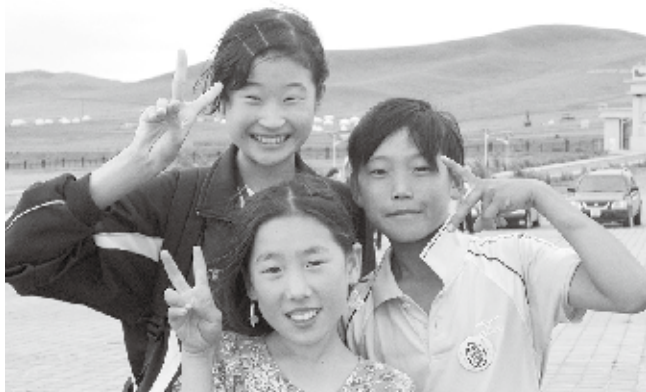
▲現地の子どもたちとも仲良しになりました

エルデネ村に行き、実際に日本との違いをたくさん実感することができました。また、現地の子ども達と交流する中で、住む国が違っても、言葉は通じなくても仲良くなれることを知りました。これからの自分にとってとてもいい経験になったと思います。今回モンゴルにいける機会をいただけて本当に良かったです。今度は弥彦村にも遊びに来てほしいです。そして弥彦の良さをたくさん伝えてあげたいと思います。