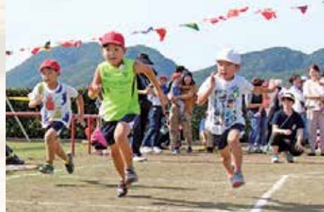
▲一等目指して、よーいドン!