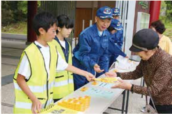
▲中学生ボランティアが避難所の受け付けを体験

午前8時からは、大雨による土砂災害や、大津波分水路の氾濫を想定し、防災訓練を行いました。避難準備情報や避難勧告を発令した場合の情報伝達や避難行動などを改めて確認する機会となりました。また、村内の約半数の自主防災組織が参加した活動訓練では、中学生ボランティアが参加して、受け付けなどを行いました。