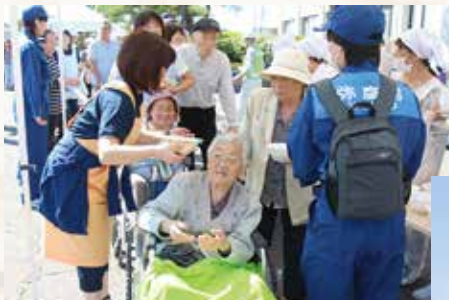
▲非常食試食会では、五目御飯と豚汁を配布しました。