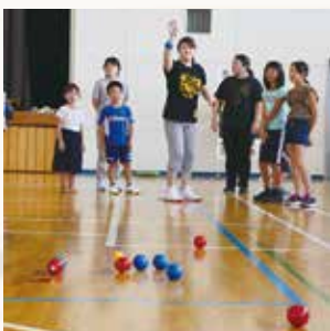
▲集中の一投！ペタンク