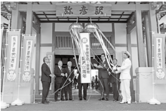
▲10月16日に行われた記念セレモニー

皆さまもこの機会に、弥彦線を利用して秋のお出かけを計画されてはいかがでしょうか。