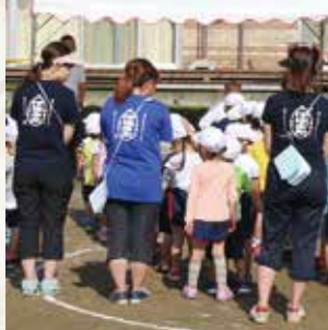
▲Tシャツで伊彌彦米をPR!