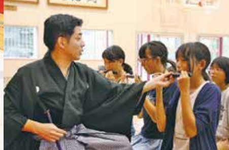
▲笛の指導を受ける児童たち