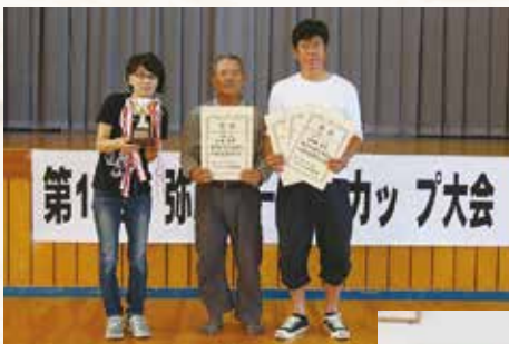
▲総合優勝の弥彦チーム！