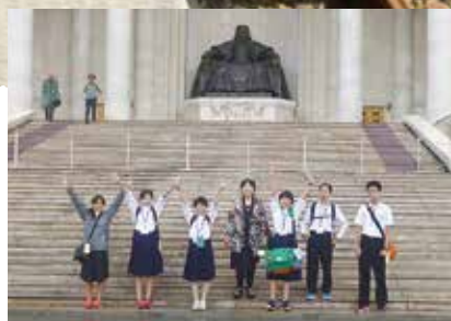
04 弥彦中学校生徒6名によるモンゴル国レポート その1