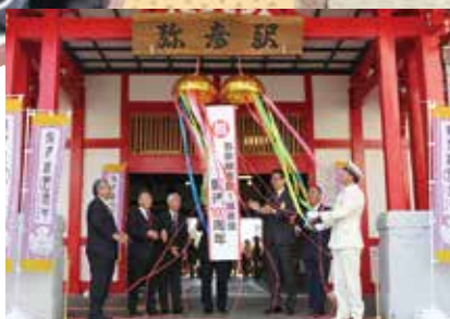
02-03 弥彦線開業百周年