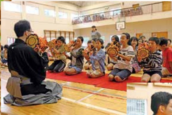
▲小鼓と合わせて、掛け声の出し方も体験しました