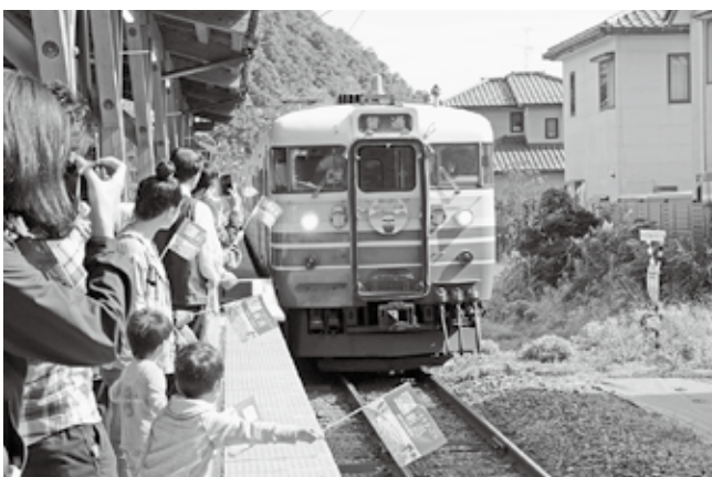
▲臨時列車「吉田・弥彦間開通100周年記念号」記念ヘッドマークをつけた車両が弥彦駅に到着！