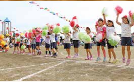
▲元気いっぱいのチアダンス

また弥彦保育園では、先生方がオリジナルの「伊彌彦米Tシャツ」を着て運動会に臨み、注目を集めていました。