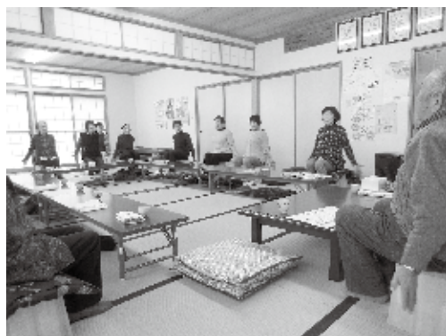
観音寺いきいきサロン