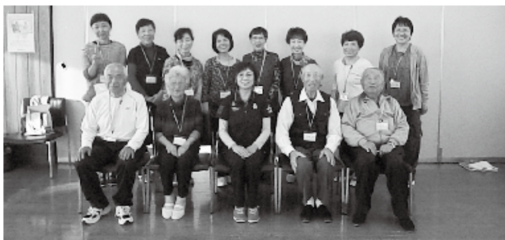
平成30年度やひこ楽ちよこ体操 サポーター養成講座修了生