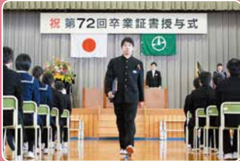
▲卒業証書を手に未来へ歩き出しました

3月5日、弥彦中学校卒業証書授与式が行われました。今年卒業した生徒は83名。これまでの中学校生活を思いながら、一人ひとり卒業証書を受け取っていました。卒業式終了後、それぞれのクラスに戻り最後の学活が行われ、担任の先生やクラスのみなどと別れを惜しみながら、中学校生活を終えました。それぞれの道に進む弥彦中学校卒業生の皆さん!これからもふるさと弥彦を胸に頑張ってください!