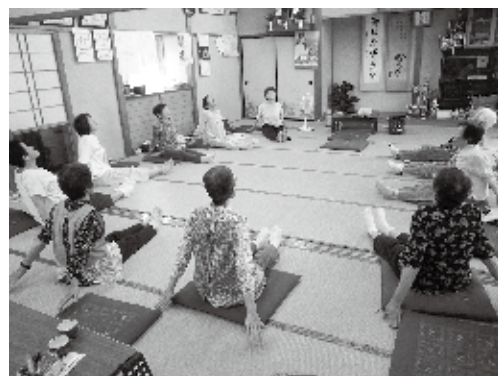
村山いきいきサロン