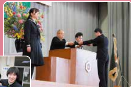
▲校長先生から卒業証書を受け取りました