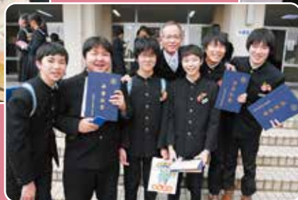
▲先生と一緒に記念写真