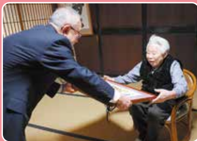
▲小林村長から御祝状が手渡されました