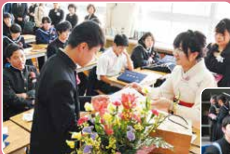
▲生徒一人ひとりにメッセージを手渡しました