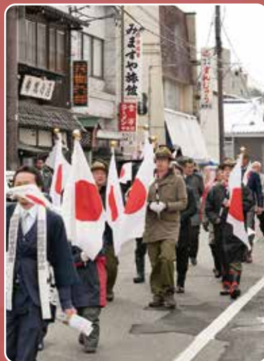
日の丸を掲げながら▶ 温泉街を行進