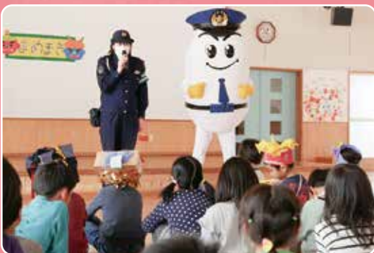
▲交通安全について勉強しました

2月1日、二松保育園で節分の豆まきと交通安全教室が行われました。保育園の先生や交通安全協会の方が鬼役となり豆まきが始まると会場は逃げ回る子どもたちで大騒ぎ。一生懸命豆をぶつけて鬼をやっつけた後は、横断歩道の渡り方などのクイズが行われ、交通安全について勉強していました。