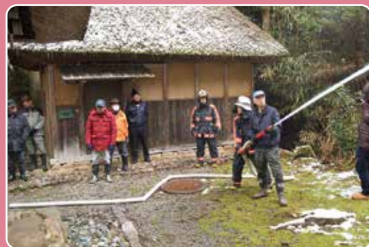
▲旧武石家住宅で放水訓練

文化財防火デーは、昭和24年1月26日に、現存する世界最古の木造建造物である法隆寺(奈良県)の金堂が炎上し、壁面が焼損したことにより1月26日に定められました。彌彦村では1月25日、旧武石家住宅で消防署指導の下、関係者による防火訓練が行われました。