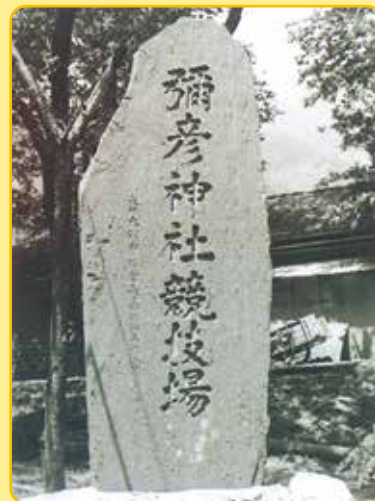
▲弥彦競輪場にある記念碑