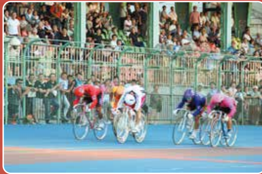
▲熱い声援が飛び交った最終レース