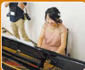
▲弥彦小学校の校歌を思い出しながら▲