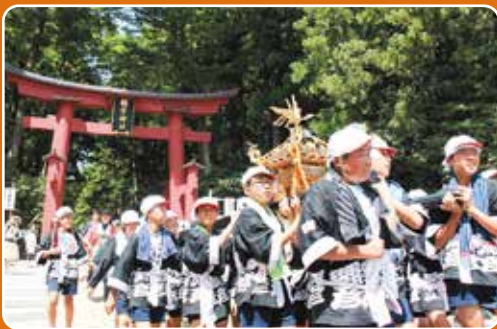
▲暑い中、子どもたちもがんばりました

毎年恒例の弥彦燈籠まつりが今年も7月24日から26日まで行われました。今年は猛暑のため子どもも神輿が短縮されましたが、みんな元気に声を出していました。夜の燈籠巡行、花火大会は天候に恵まれ、大変雰囲気の良い燈籠押しでした。