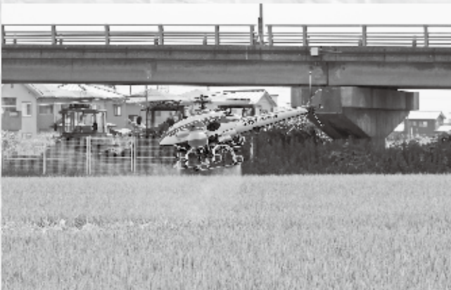
▲ラジコンヘリによる病害虫防除