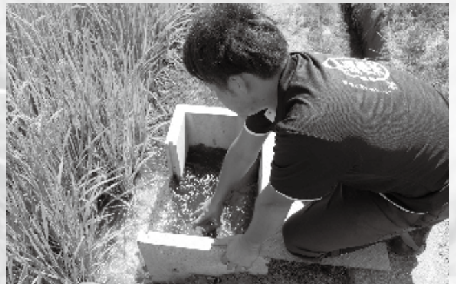
▲田んぼの様子を見て水の管理