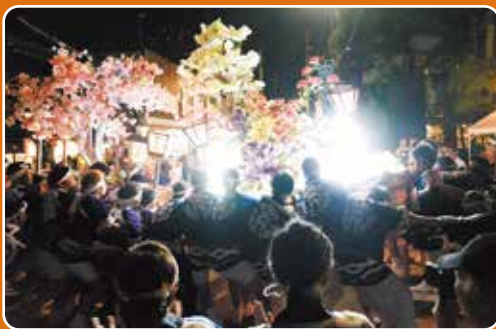
▲一の鳥居前での大燈籠、迫力のもみ合い