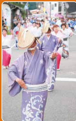
▲みなさん息ぴったり!