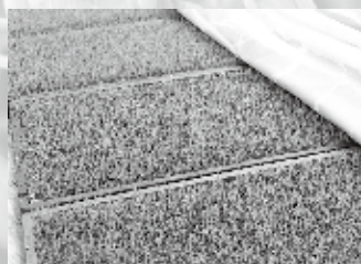
④1週間ほどで芽がでてきます