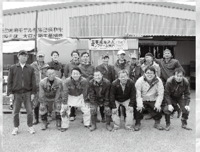
▲サンファーム大戸のみなさん