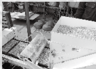
②種もみをまきます