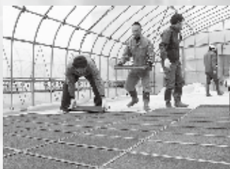
③これが重労働です