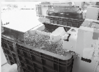
①種を水に一晩浸します

この他にも田んぼの状態を整える作業を同時に行い、ゴールデンウィークごろの田植えに向けた準備を進めます。(次号に続く)