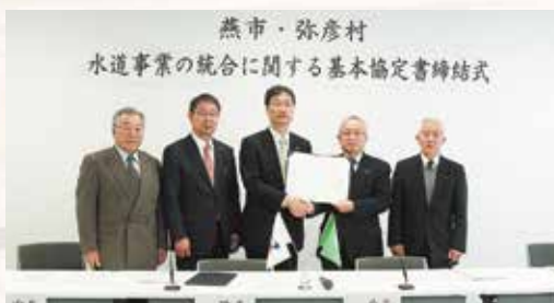
燕市・弥彦村 水道事業の統合に関する基本協定書締結式

2月7日、弥彦村と燕市の水道事業の統合に関する基本協定を締結しました。共通課題である上水道施設の老朽化に対し、水道事業を統合し、共同で浄水場を更新整備することで、建設コストの削減が見込めることから締結に至りました。