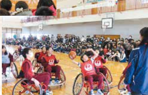
試合形式で車いす バスケットボールを体験▶