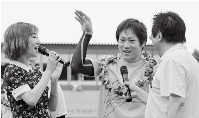
▲フライングゲット！

9/4(月)～9/6(水) FⅠ 10/10(火)～10/12(木) FⅠ 11/3(金・祝)～11/5(日) FⅠ 9/20(水)～9/22(金) FⅠ 10/28(土)～10/30(月) FⅡ