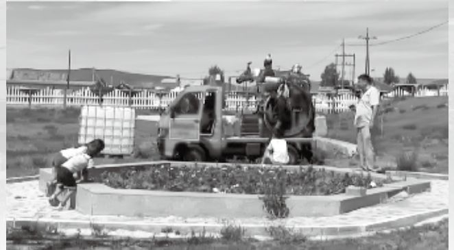
▲弥彦村から寄贈した小型ポンプ付積載車（消防車）

モンゴル国は非常に乾燥した地域のため、小さな火事が原因で大きな災害になりかねません。実際、派遣前日にも大きな山火事がありエルデネ村役場職員も動員がかかったそうです。弥彦村が寄贈した消防車が国境を越えてエルデネ村の安全のために貢献してくれることを期待しています。