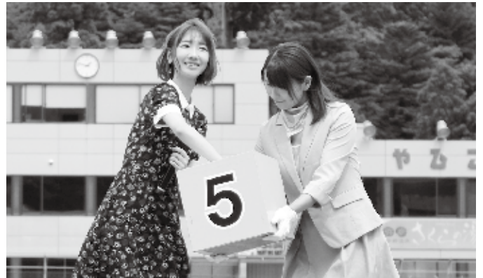
▲誰に当たるかな？ゆきりん抽選中