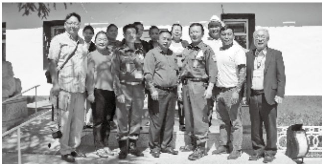
▲エルデネ村役場庁舎前にて記念撮影をする訪問団一行と、エルデネ村の皆さん