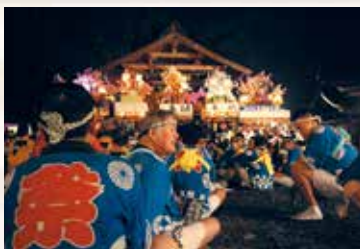
▶まつり終盤、神社に奉納した燈籠