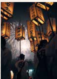
▲それぞれの願いを込めた田楽