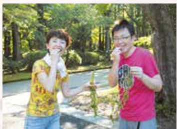
▲新鮮!甘くてうまい!品種は越後ハニー。

8月6日、雲一つない晴天の中、枝豆収穫体験が行われました。畑に着くなり枝豆の青い香りがしてきます。汗を掻き掻き収穫したあとは、お待ちかねの試食タイム。枝が付いた状態で茹でられた獲りたての枝豆をパクリ。「んん！おいしい!!」この状態で食べられるのは収穫体験ならではの、そのおいしさに皆さん満足でした。