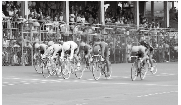
▲決勝戦、ゴールの瞬間