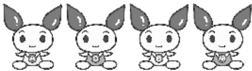
献血キャラクター

■問合せ 新潟県赤十字血液センター 献血推進課 025-230-1703 福祉保健課 94-3133