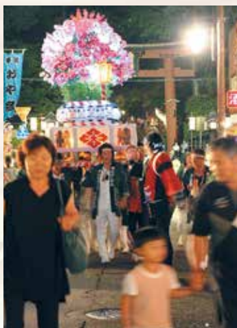
▲賑わう神社前通り

今年の燈籠まつりは、生憎の悪天候のため、24日の前夜祭は中止となってしまい、続く25日に行われた子ども燈籠押しはどしゃ降りの中での開催となりました。しかし、夜になると雨もやみ、花火大会、大燈籠巡行などが盛大に行われました。ドーンと間近で打ち上がる花火や太鼓や笛の祭囃子の音。そして、雨上りの夜空に映える燈籠のオレンジ色と、色鮮やかなはっぴを着て華やかな燈籠を叩合う講中、楽しいまつりとなりました。目にも耳にも賑やかで