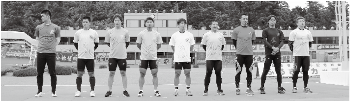
▲決勝戦出場の9選手