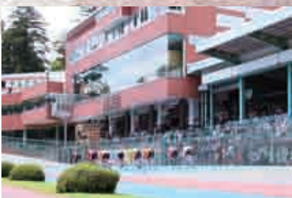
02-03 がんばってます「やひこけいりん」