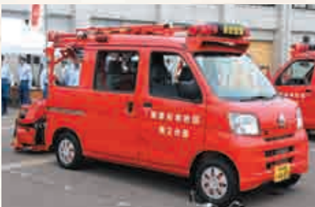
▲新積載車お披露目