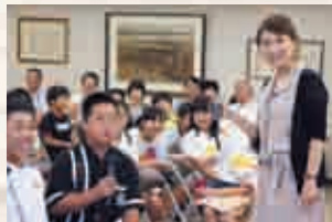
▲20秒以内でPR原稿読めるかな？