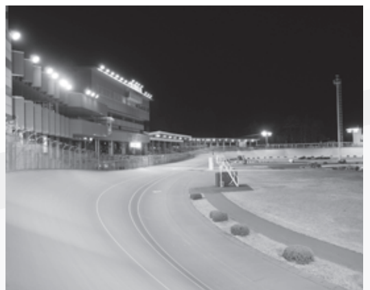
▲ミッドナイト競輪8月より開催予定！

現在、全国43の競輪場で競輪が開催されていますが、同様に厳しい状況でしたので、関係者により競輪事業のあり方が話し合われ、収益改善のための施策が執られることになりました。①売上の少ない昼間開催の日数削減、②ミッドナイト競輪の開催日数増加、③お客様満足度の向上、新規のお客様獲得のための施策の実施、この3つを柱に実施することとなりました。①の実施により平成27年度、弥彦競輪では6年ぶりに一般会計へ繰り出すことができました。②については、立地状況により実施できない競輪場もある中、弥彦競輪では地域の皆さまのご理解を得ながら、8月からミッドナイト競輪を始めることとし