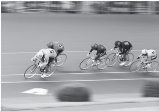
▲ジャンの音で加速するレース、迫力満点！

弥彦競輪は、昭和51年から弥彦小学校の社会科副読本でも採り上げられており、改訂を続けながら今も続いています。中には児童による競輪についての作文も掲載されています。弥彦競輪と地域住民の皆さまとの関わり合いを大切にしながら豊かな村づくりへ貢献できるよう頑張ります。