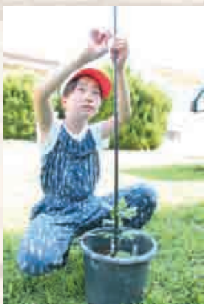
▲真っ直ぐ育ちますように！

5月に引き続き清香会の方々を講師に迎え、弥彦小学校の4年生が菊の植替えにチャレンジしました。小さい5号鉢から大きい9号鉢に植替え、菊がまつすぐ育つよう金具と支柱で支えます。茎が折れないよう注意しながら、真剣に取り組んでいました。