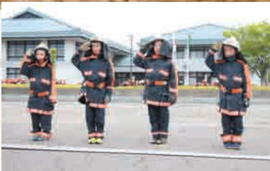
▲敬礼！ちびっこ消防隊

6月18日（日）、役場駐車場で弥彦村消防演習が行われました。各分団とも息の合った行進や小型ポンプ操法を披露し、会場からは大きな拍手が送られました。また、昨年末に導入されました小型動力ポンプ付積載車のお披露目及びびっ子消防隊「放水披露も行われ、会場は喝采と和やかな雰囲気になりました。