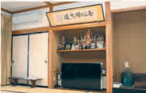
▲TVの設置により災害時の情報収集に役立ってます。