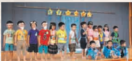
▲きく組さんの七夕劇☆