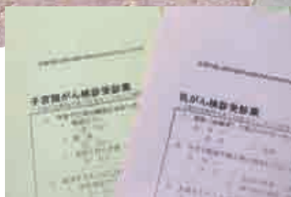
07 乳がん検診・子宮頸がん検診のお知らせ