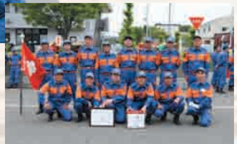
▲優勝した第7分団の皆さん