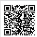
国税庁HP 「タックスアンサー」

国税庁ホームページ「タックスアンサー」・「税の情報・手続・用紙」をご覧ください。