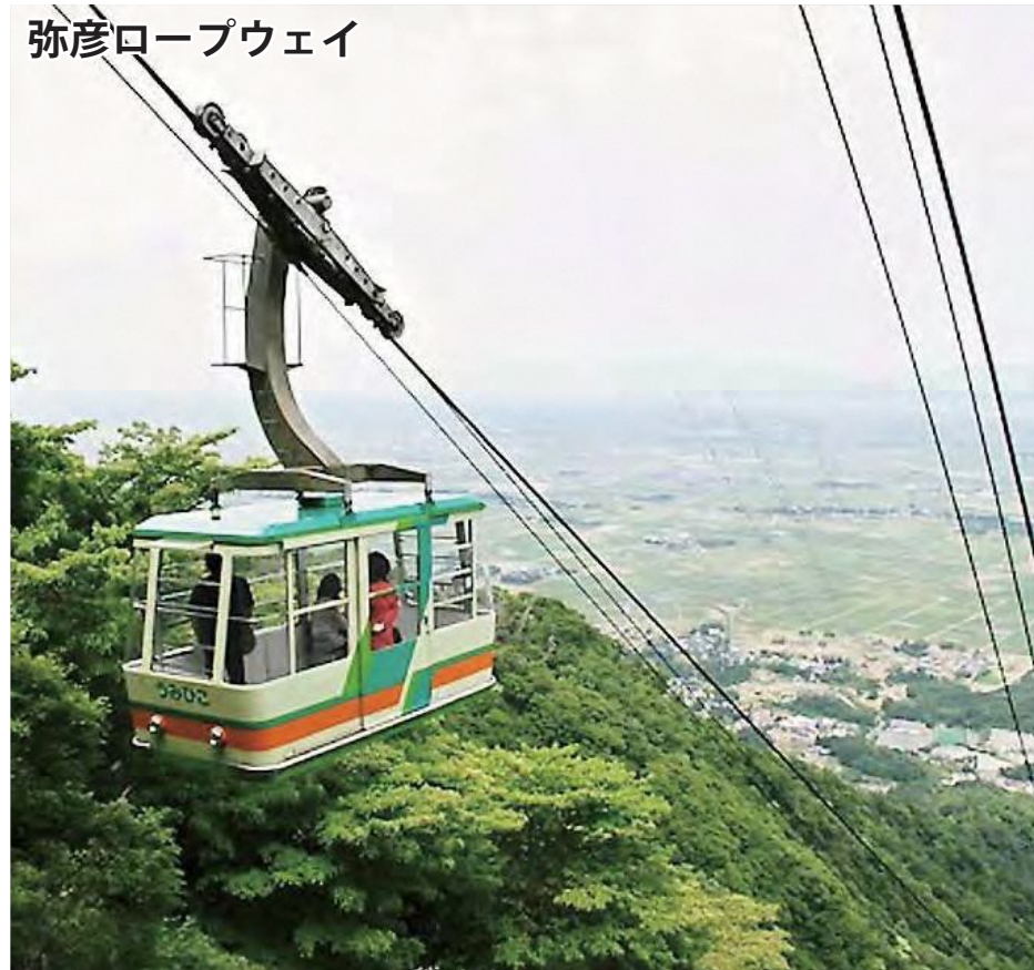
弥彦ロープウェイ