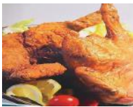
【新潟名物】 鶏の半羽唐揚げ (カレー味 × 1 枚 旨塩味 × 2 枚セット) 9,000 円 鶏の半羽唐揚げ (カレー味 × 2 枚 旨塩味 × 1 枚セット) 9,000 円