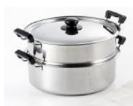
蒸しもの鍋 28cm (ふかしネット付) 18,000 円