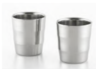
2 重タンブラー 240ml × 2 個 18,000 円