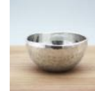
純錫 ぐい呑み 40cc 18,000 円