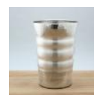
銅製錫被カップ 200cc 20,000 円