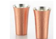
純銅槌目タンブラー-M 380ml × 2 個 11,000 円