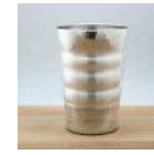
銅製錫被カップ 200cc 20,000 円