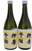
【地酒 720ml × 2 本】 弥彦愛國 純米吟醸酒 19,000 円