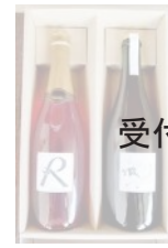
2018 年 受付期間外 マスカットベイリーA 自然派 スパークリングワイン 2 種 23,000 円