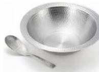
ちりすき鍋 26cm (スプーンレンゲ付) 10,000 円