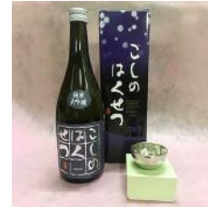
鎚起工房 清雅堂 「純錫ぐい呑み」×1 個 「泉流こしのはくせつ」720ml ×1 本 32,000 円