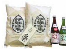
「伊彌彦米」特別栽培米コシヒカリ 5kg、 「こしのはくせつ」特別純米酒 720ml × 1 本 17,000 円 「伊彌彦米」特別栽培米コシヒカリ 10kg (5kg × 2 袋)、 「こしのはくせつ」純米吟醸酒、吟醸酒 720ml × 各 1 本 34,000 円