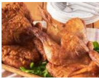
【完全受注生産！新潟名物】 鶏の半羽唐揚げ (旨塩味 1 枚 & 和風唐揚げ 300g セット) 5,000 円 鶏の半羽唐揚げ (カレー味 1 枚) 受付期間外 セット) 5,000 円 鶏の半羽唐揚げセット (カレー味 & 旨塩味各 2 枚) 10,000 円