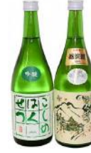
【地酒 720ml × 2 本】 「こしのはくせつ」特別純米酒・吟醸酒 2 本の飲み比べセット 14,000 円