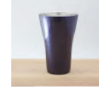
銅製 紫銅色 タンブラー (小) 180cc 33,000 円