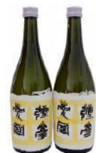
【地酒 720ml × 2 本】 弥彦愛國 純米吟醸酒 17,000 円