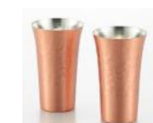
純銅槌目タンブラーM 380ml × 2 個 10,000 円