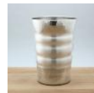
銅製錫被カップ 200cc 18,000 円