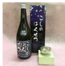
鎚起工房 清雅堂 「純錫ぐい呑み」× 1 個 「泉流こしのはくせつ」720ml × 1 本 30,000 円