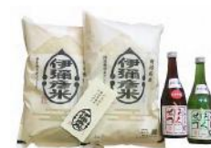
「伊彌彦米」特別栽培米コシヒカリ 5kg、 「こしのはくせつ」特別純米酒 720ml × 1 本 15,000 円 「伊彌彦米」特別栽培米コシヒカリ 10kg (5kg × 2 袋)、 「こしのはくせつ」純米吟醸酒、吟醸酒 720ml × 各 1 本 30,000 円