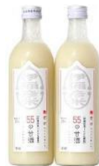
【甘酒 500ml × 2 本】 伊彌彦米 55 の甘酒 10,000 円