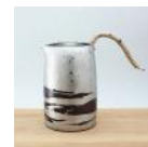
銅製錫被 徳利 (小) 250cc 30,000 円

寄附のお申し込みは、さとふる・ふるさとチョイスもしくは弥彦村 HP からお願いいたします。