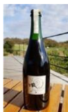
弥彦 2018 マスカットベイリーA 自然派 スパークリングワイン 11,000 円