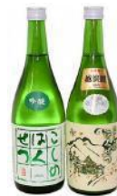
【地酒 720ml × 2 本】 「こしのはくせつ」特別純米酒・吟醸酒 2 本の飲み比べセット 12,000 円