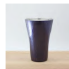
銅製 紫銅色 タンブラー (小) 180cc 30,000 円