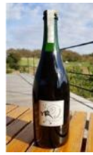
弥彦 2018 マスカットベイリー A 自然派 スパークリングワイン 11,000 円