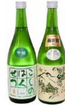
【地酒 720ml × 2 本】 「こしのはくせつ」特別純米酒・吟醸酒 2 本の飲み比べセット 12,000 円