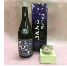
鎚起工房 清雅堂 「純錫ぐい呑み」× 1 個 「泉流こしのはくせつ」720ml × 1 本 30,000 円