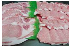
弥彦村産豚肉 1.2kg セット (ロース) 12,000 円 1.5kg セット (肩ロース・バラ) 12,000 円 1.5kg セット (肩ロース・モモ・バラ) 12,000 円 2.0kg セット (ロース) 19,000 円 2.2kg セット (ロース・肩ロース・バラ) 19,000 円 2.4kg セット (肩ロース・バラ) 18,000 円