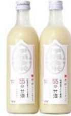
【甘酒 500ml × 2 本】 伊彌彦米 55 の甘酒 10,000 円