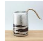
銅製錫被 徳利 (小) 250cc 30,000 円

寄附のお申し込みは、さとふる・ふるさとチョイスもしくは弥彦村 HP からお願いいたします。