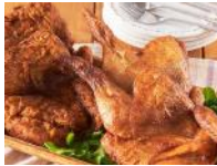
【完全受注生産！新潟名物】