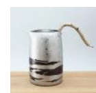
銅製錫被 徳利 (小) 250cc 30,000 円