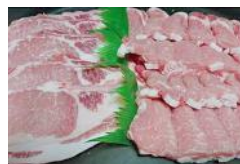
弥彦村産豚肉 1.2kg セット (ロース) 12,000 円 1.5kg セット (肩ロース・バラ) 12,000 円 1.5kg セット (肩ロース・モモ・バラ) 12,000 円 2.0kg セット (ロース) 19,000 円 2.2kg セット (ロース・肩ロース・バラ) 19,000 円 2.4kg セット (肩ロース・バラ) 18,000 円