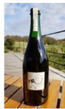
弥彦 2018 マスカットベリリー A 自然派 スパークリングワイン 11,000 円