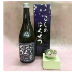
錠起工房 清雅堂 「純錫ぐい呑み」× 1 個 「泉流こしのはくせつ」720ml × 1 本 30,000 円