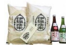
「伊彌彦米」特別栽培米コシヒカリ 5kg、 「こしのはくせつ」特別純米酒 720ml × 1 本 15,000 円 「伊彌彦米」特別栽培米コシヒカリ 10kg (5kg × 2 袋)、 「こしのはくせつ」純米吟醸酒、吟醸酒 720ml × 各 1 本 30,000 円