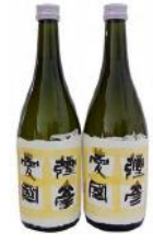
【地酒 720ml × 2 本】 弥彦愛國 純米吟醸酒 17,000 円 【地酒 1.8L × 2 本】 彌彦愛國 純米吟醸酒 34,000 円