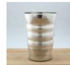
銅製錫被カップ 200cc 18,000 円