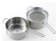
栗原はるみ IH 対応 W フライヤー 20cm 14,000 円