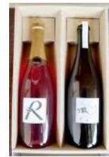
弥彦 2018 マスカットベリリー A 自然派 スパークリングワイン 2 種 23,000 円