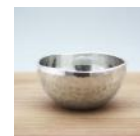
純錫 ぐい呑み 40cc 16,000 円