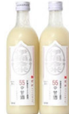
【甘酒 500ml × 2 本】 伊彌彦米 55 の甘酒 10,000 円 【甘酒 500ml × 6 本】 伊彌彦米 55 の甘酒 26,000 円 【甘酒 500ml × 12 本】 伊彌彦米 55 の甘酒 50,000 円