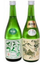
【地酒 720ml × 2 本】 「こしのはくせつ」特別純米酒・吟醸酒 2 本の飲み比べセット 12,000 円 【地酒 1.8L × 2 本】弥彦産山田錦使用 「こしのはくせつ」純米吟醸酒・吟醸酒 飲み比べセット 26,000 円