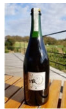
弥彦 2018 マスカットベリリー A 自然派 スパークリングワイン 11,000 円