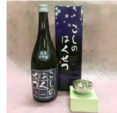
錠起工房 清雅堂 「純錫ぐい呑み」× 1 個 「泉流こしのはくせつ」720ml × 1 本 30,000 円