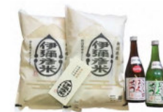
「伊彌彦米」特別栽培米コシヒカリ 5kg、 「こしのはくせつ」特別純米酒 720ml × 1 本 15,000 円 「伊彌彦米」特別栽培米コシヒカリ 10kg (5kg × 2 袋)、 「こしのはくせつ」純米吟醸酒、吟醸酒 720ml × 各 1 本 30,000 円