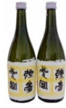
【地酒 720ml × 2 本】 弥彦愛國 純米吟醸酒 17,000 円 【地酒 1.8L × 2 本】 彌彦愛國 純米吟醸酒 34,000 円