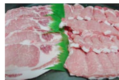
弥彦村産豚肉 1.2kg セット (ロース) 12,000 円 1.5kg セット (肩ロース・バラ) 12,000 円 1.5kg セット (肩ロース・モモ・バラ) 12,000 円 2.0kg セット (ロース) 19,000 円 2.2kg セット (ロース・肩ロース・バラ) 19,000 円 2.4kg セット (肩ロース・バラ) 18,000 円