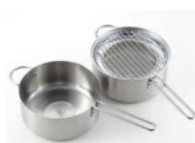
栗原はるみ IH 対応 W フライヤー 20cm 14,000 円